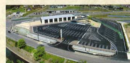
世羅町観光協会 (道の駅世羅) TEL.0847-22-4400 【アクセス】 世羅町役場から車で5分 道の駅世羅構内