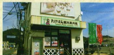
たけはら観光案内所 (竹原市観光協会) TEL.0846-22-4331 【アクセス】 竹原駅から徒歩 30 秒