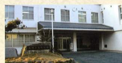
大崎上島町役場地域経営課 TEL.0846-65-3123 【アクセス】 白水港から徒歩1分 大崎上島町役場庁舎内