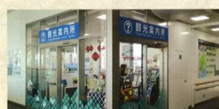
東広島市観光案内所 TEL.082-430-7701 【アクセス】 西条駅構内