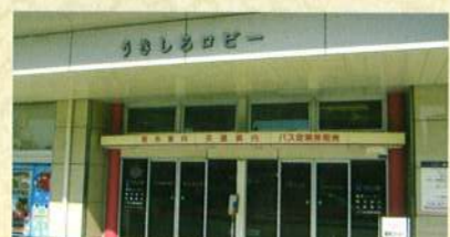
うきしろロビー (三原観光協会観光案内所) TEL.0848-67-5877 【アクセス】 三原駅構内