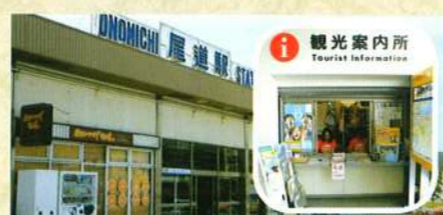
尾道駅観光案内所 TEL.0848-20-0005 【アクセス】 尾道駅構内