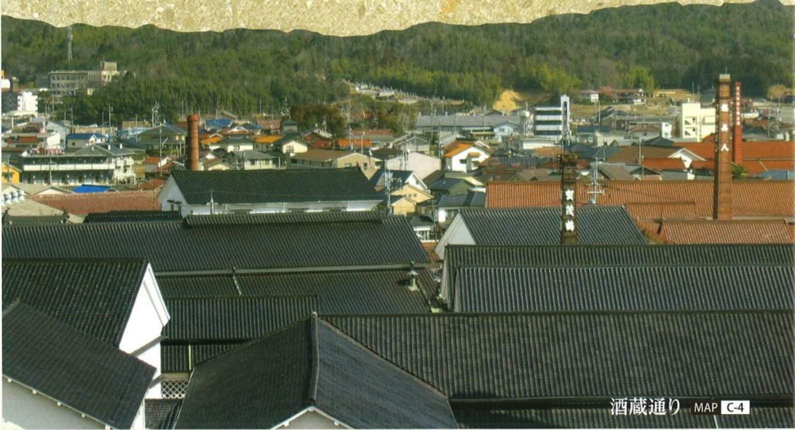
酒蔵通り MAP C-4

各蔵元から伸びるレンガの煙突がまちを彩る西条・酒蔵通り。ここに、日本の酒造りの誇りがあります。