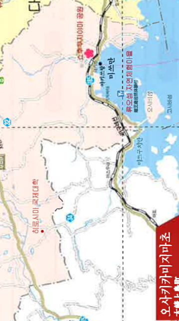
MAP B-4 미즈리야마 유적 MAP B-5 유오지연세형촌 MAP B-2 미야마 협곡