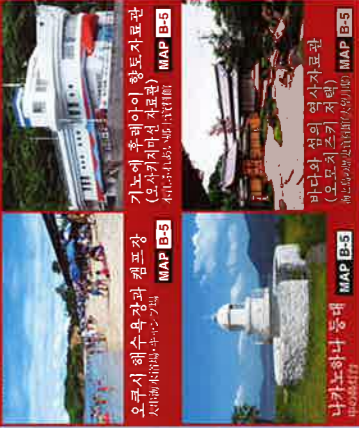
MAP B-5 미야마 협곡 유적 MAP B-5 유오지연세형촌 MAP B-2 미야마 협곡