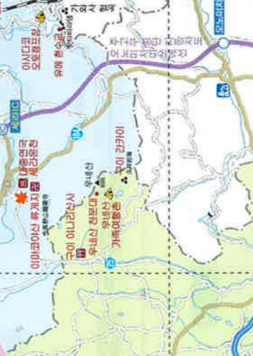
MAP D-2 세라 공회관(세라 화이너리) MAP C-3 세라 공회관(세라 화이너리) MAP C-2 홍과 공의 고향 포루만 MAP D-3 고토쿠지