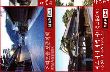
MAP B-4 미즈리야마 유적 MAP B-5 유오지연세형촌 MAP B-2 미야마 협곡