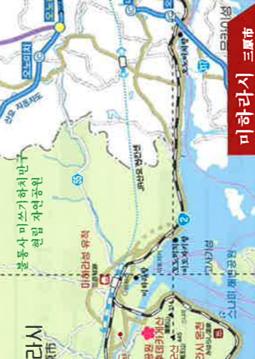
MAP D-2 미하라시 시청 MAP C-3 미하라시 시청 MAP C-2 미하라시 시청 MAP D-3 미하라시 시청