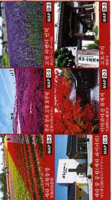
MAP D-2 세라 공회관(세라 화이너리) MAP C-3 세라 공회관(세라 화이너리) MAP C-2 홍과 공의 고향 포루만 MAP D-3 고토쿠지