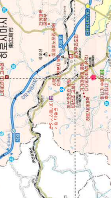
MAP B-3 미쓰즈 고분 MAP B-4 가가미야마성 유적 MAP B-5 유오지연세형촌 MAP B-2 미야마 협곡