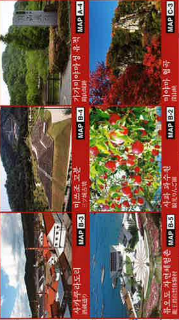
MAP B-3 미쓰즈 고분 MAP B-4 가가미야마성 유적 MAP B-5 유오지연세형촌 MAP B-2 미야마 협곡